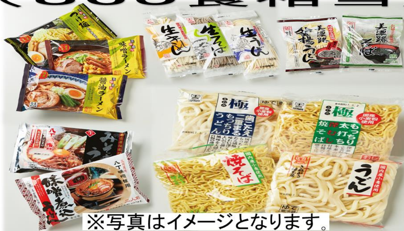
※写真はイメージとなります。

注意: ホールインワン保険証明書の発行条件とは異なりますので、予めご了承願います。